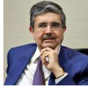
Uday Kotak, Founder and Director of Kotak Mahindra Bank (file photo)

"We should prepare for paranoia before the event,"