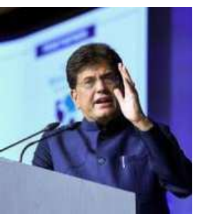
Union Minister Piyush Goyal addresses the CII Annual Business Summit 2026

There are, however, challenges to be ironed out in the India-Chile FTA talks. "I met the Chilean Foreign Minister here. There are challenges given the different size of the economies and different